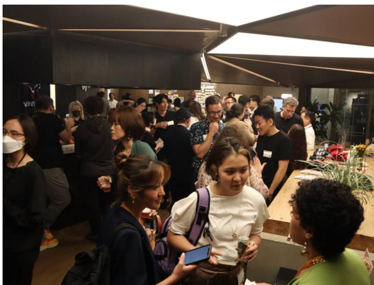
<Venture Café Tokyo のプログラムの様子>

【イベント】 2024 年 2 月 13 日(火) Fukuoka Growth Next(福岡市中央区大名)にて開催予定 ※自由参加 ※詳細は決まり次第ご案内いたします