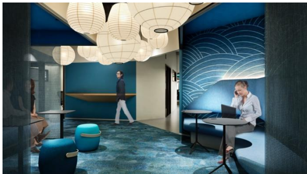
<廊下・共用スペース>