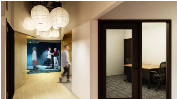
<廊下・プライベートオフィス>