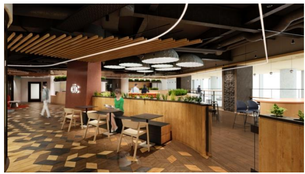
<キッチン・カフェスペース>