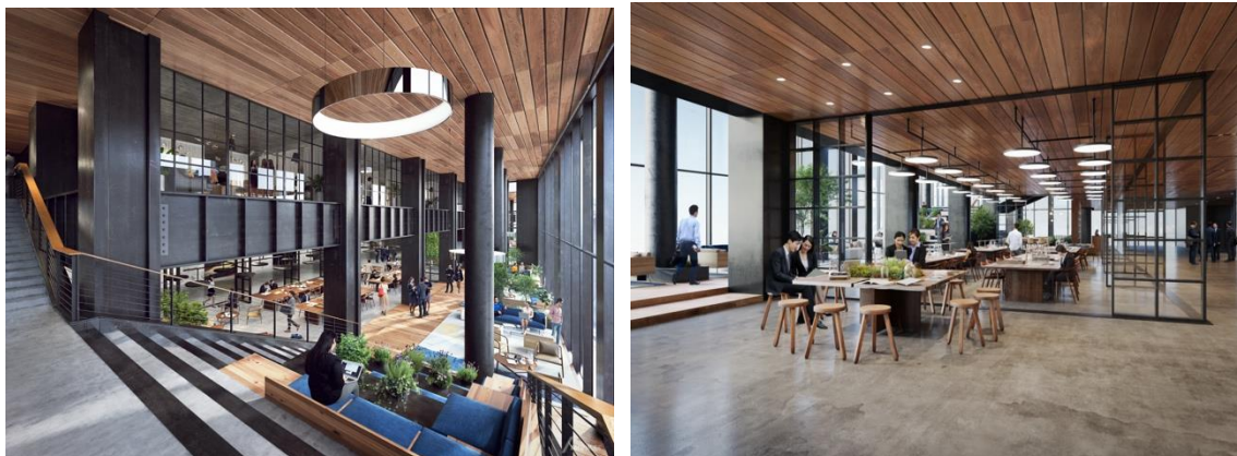
<(仮称)新福岡ビル開業後にプログラムの実施会場となる 6 階スカイロビーイメージ>

【開催場所】 2024 年秋～:天神エリア 2025 年春以降:(仮称)新福岡ビル 6 階スカイロビー