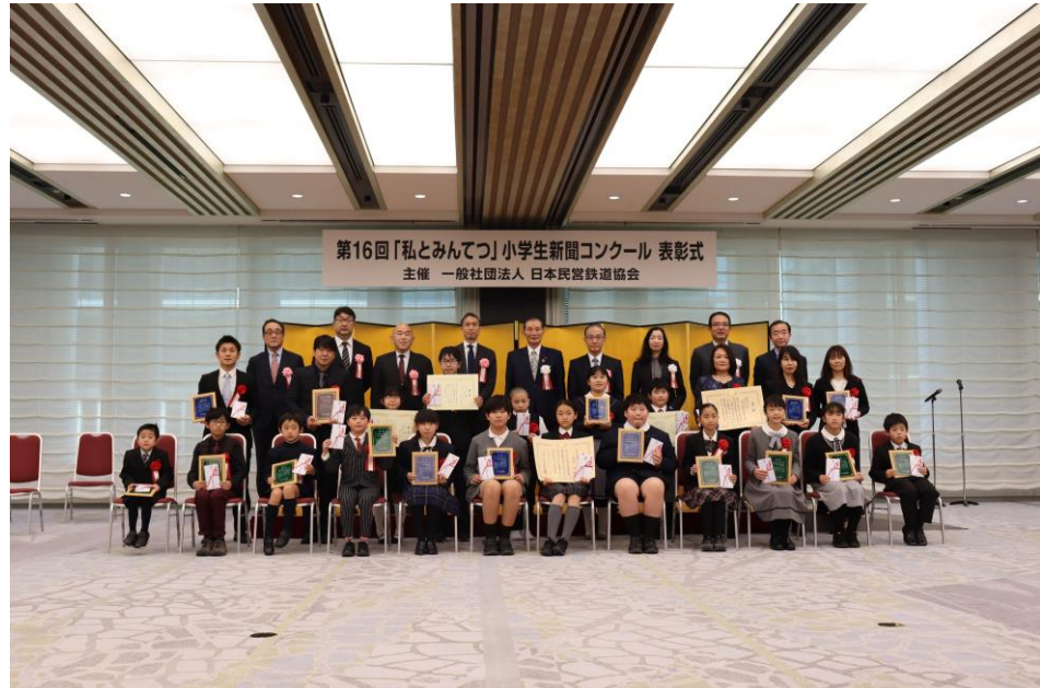
第16回新聞コンクール表彰式の様子（東京 経団連会館）