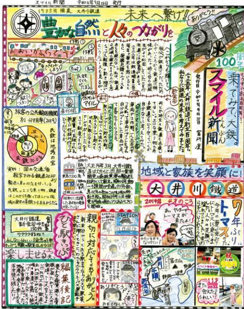
第16回新聞コンクール最優秀作品