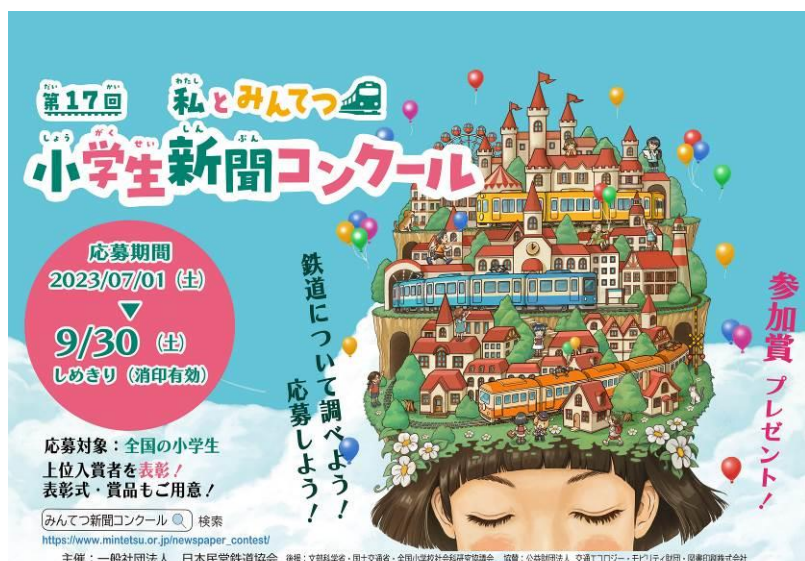
掲出ポスター（列車内用）