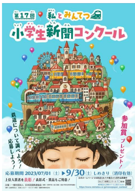
掲出ポスター（駅構内用）

また、鉄道への理解を深めることができる「みんてつキッズ」（小学生向けサイト）や「鉄道ってなあに？」（小学生向け教材）、新聞の作り方を紹介する動画をWEBに公開します。