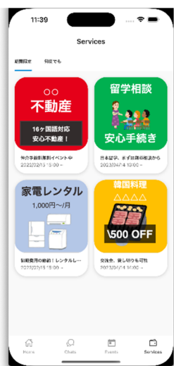
在留外国人向けサービス提供