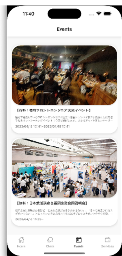
イベント情報提供