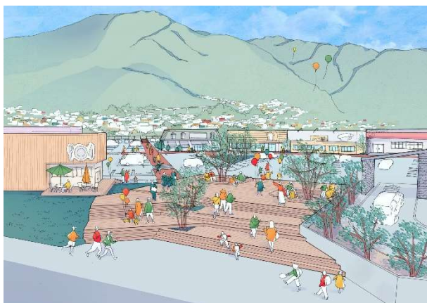
商業エリアパース