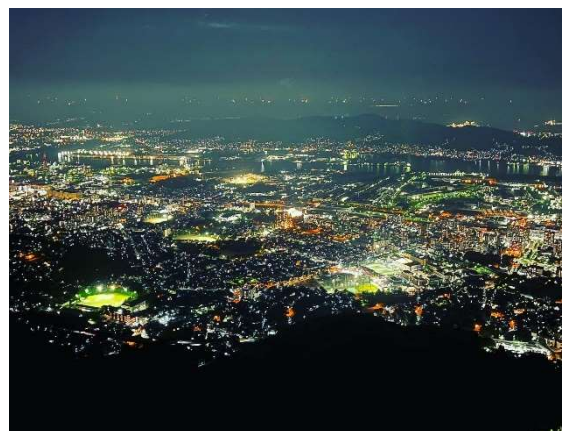
皿倉山からみる八幡東区