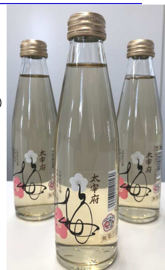
商品イメージ ※一部デザインパッケージが異なるものがあります