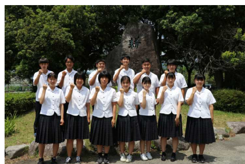
今回携わってくださった、福岡農業高等学校の皆さま