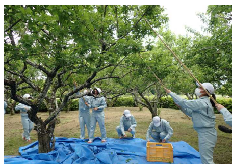
福農生による梅収穫の様子