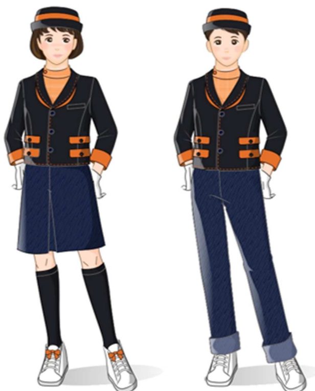
ユニフォームイメージ