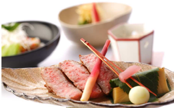
夕食例(季節に合わせた食事を提供)