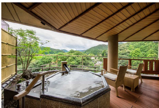
露天風呂付き客室

詳細は大谷山荘公式ホームページをご確認ください。( https://otanisanso.co.jp/ )