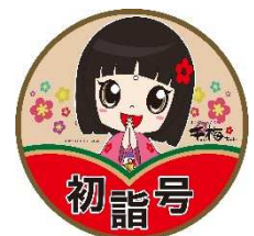
初詣号ヘッドマーク