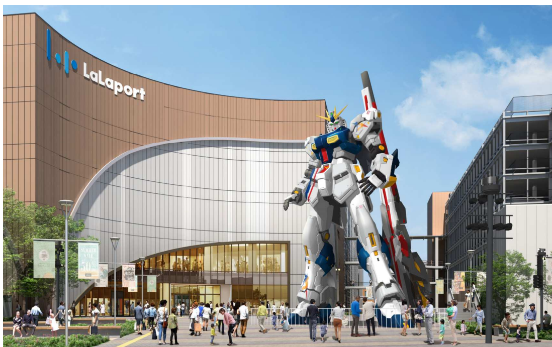
「実物大νガンダム立像」イメージパース ©創通・サンライズ