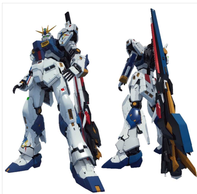
「RX-93ff νガンダム」©創通・サンライズ