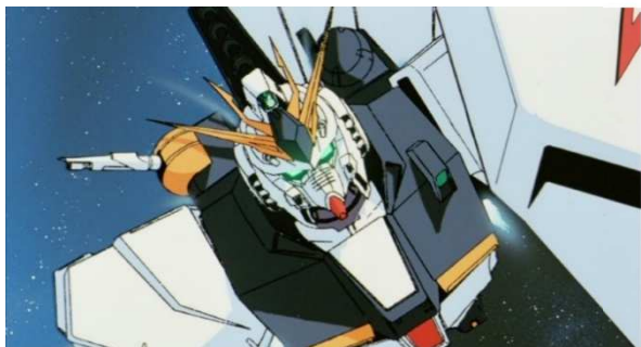
『機動戦士ガンダム 逆襲のシャア』

『機動戦士ガンダム』シリーズ総監督。演出家。1941年生まれ、小田原市出身。TVアニメ『鉄腕アトム』の演出を経てフリーに。主な監督作品に『機動戦士ガンダム』『伝説巨神イデオン』などがある。作詞、小説の執筆なども手掛ける。