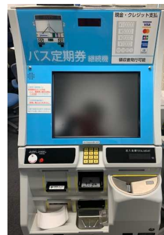
※自動継続機イメージ