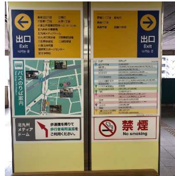
※駅構内掲出のバス乗り場案内