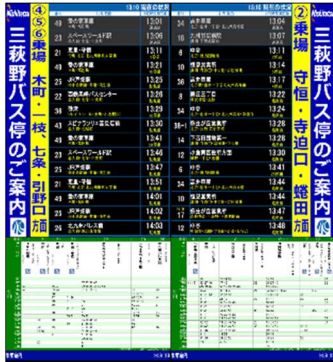
※案内モニター画面イメージ