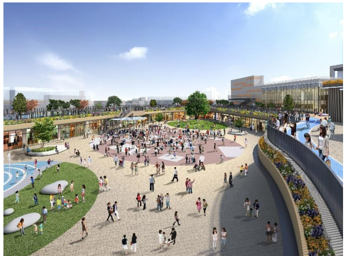
屋外広場イメージ

ファッション、雑貨、飲食、エンターテインメント施設等、話題性の高い店舗をそろえ、ファミリー層はもちろんのこと、シニア・ヤング層まで幅広い世代のお客さまが楽しめる、出会いと体験に満ちた新しい施設を目指します。