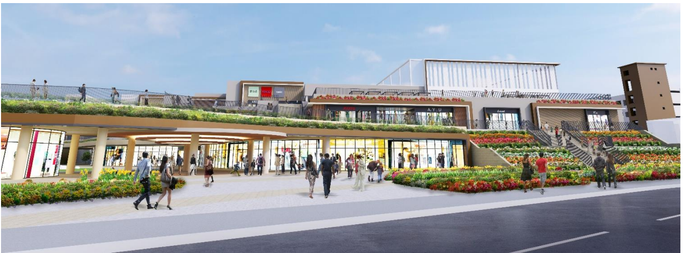
西側外観イメージ