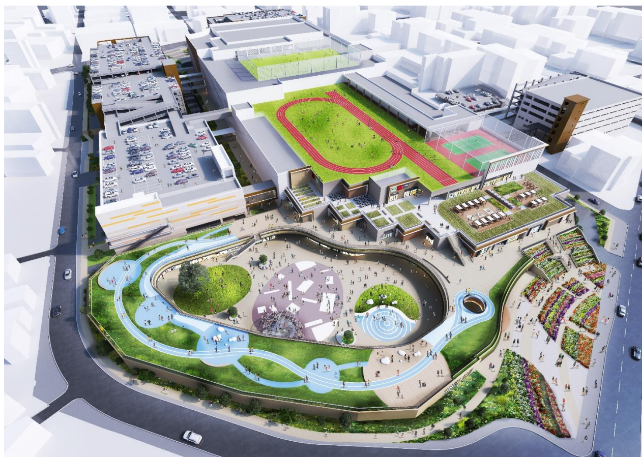
建物全体イメージ

当事業は、広場空間や商業機能の中核に、福岡・九州の魅力発信、周辺地域の生活の質の向上、開かれた場づくり等、都市機能の充実に寄与するものです。福岡市におけるまちづくりの新たな拠点として、多様な人々が集い出会う広場空間をはじめとした、コミュニティの拠点となる活気あふれる商業空間を創出するとともに、新たな生活様式に対応した施設計画とすることで、福岡市が進める感染症対応シティの取り組みや安全安心で魅力的なまちづくりに貢献してまいります。