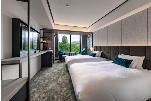
スタンダードツイン