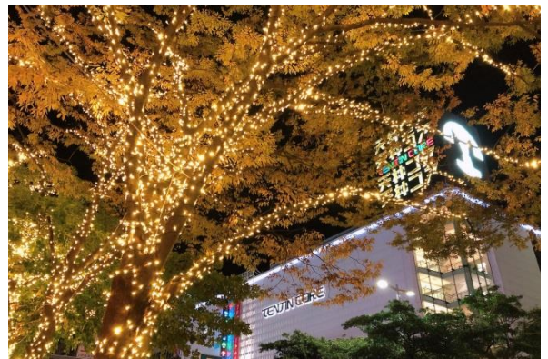
過去実施時の様子