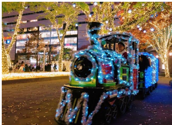
過去実施時の様子