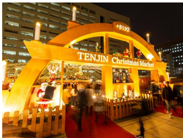
過去実施時の様子