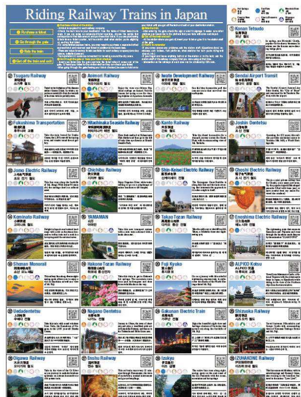
『訪日外国人用ガイドマップ』（東日本版）【表面（左）・裏面（右）】