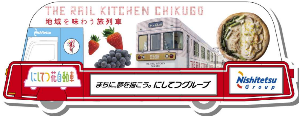
1号車：地域を味わう旅列車 THE RAIL KITCHEN CHIKUGO