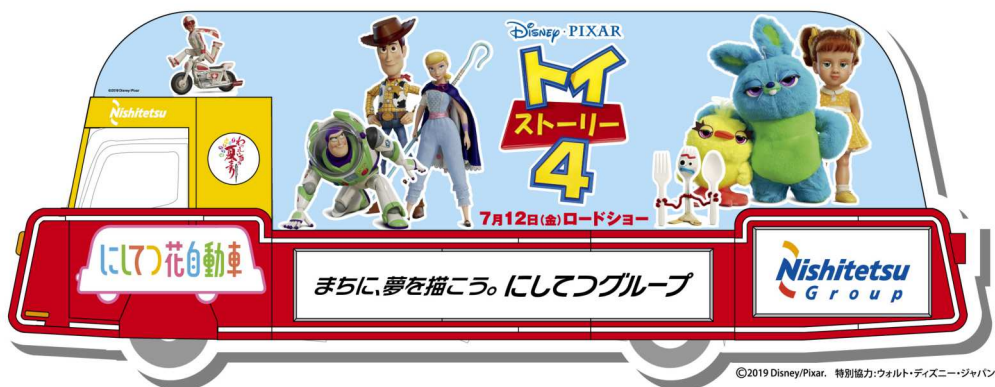
2号車：ディズニー／ピクサー最新作 トイ・ストーリー4