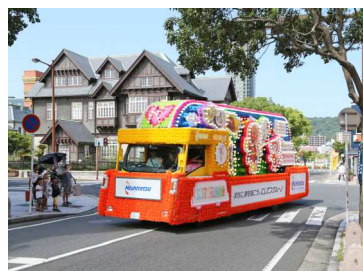
北九州市内での運行