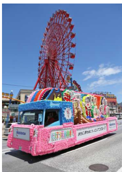
チャチャタウン小倉での展示