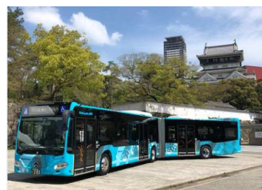
パレードと一緒に登場する連節バス