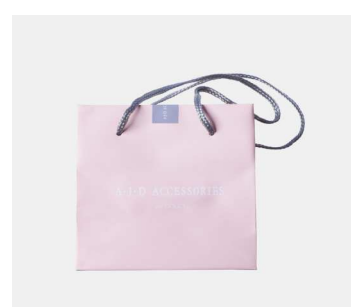
1F アジェデアアクセサリーズ イヤリング、ネックレス等 5～6点 通常 6千円相当が 2,160円 (税込)に!