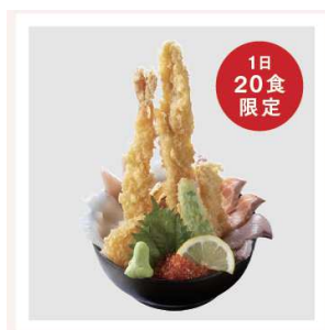
B2F 喜水丸 福岡海鮮タワー天井 1,000円(税込)