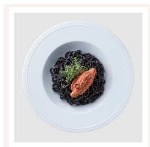
B2F ヒッコリー 黒い明太子スパゲッティ 1,380円(税込)