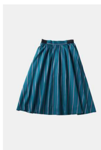
1F アンドットノスタルジア タックミモレスカート 通常 4,212円→2,000円 (いずれも税込)