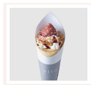
VITO あまおうクレープ 540円(税込)

※LINE でお友達になると新・福岡名物コレクション対象メニューがその場で 100円 OFF となる LINE@キャンペーンも同時開催!