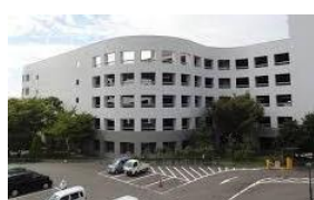
ボートレース福岡 第1立体駐車場