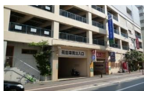
グランドパーキング