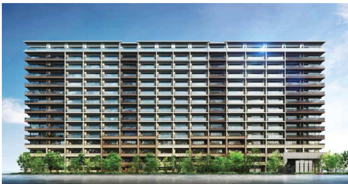
完成予想 CG パース