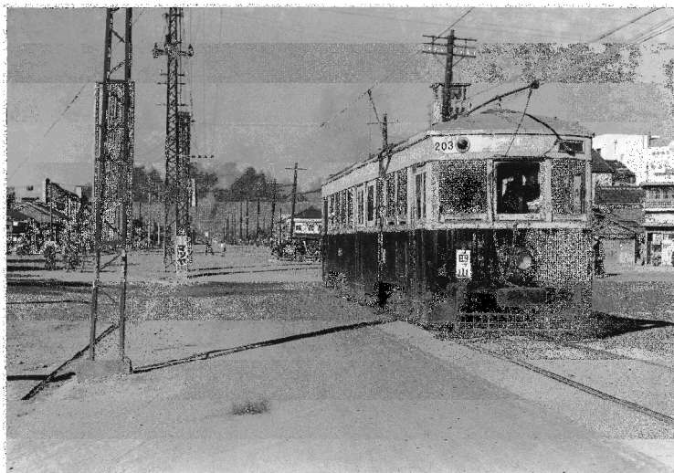
同形の 203 号が走る大牟田市内線