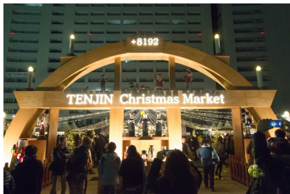
過去実施時の様子