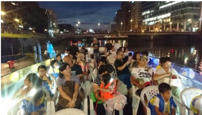
昨年のイベントの様子