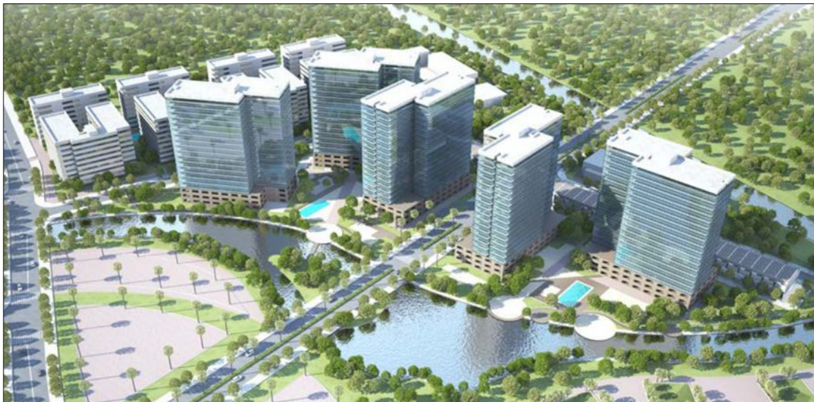
※「MIZUKI PARK (第1期)」のイメージパース