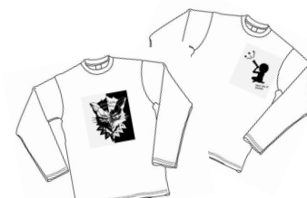
学生がデザインしたアイテム イメージ

【内容】 大村美容ファッション専門学校が毎年開催しているファッションショー「OMULA FINAL CONTEST」のアンテナショップとして運営し、天神コアに出店中のアパレルショップ「スピズ(株)ヒューマンフォーラム運営」監修のもと、学生が仕入れ、リメイクした古着の販売や学生がデザインしたアイテムを商品化し、販売。