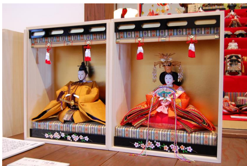
雛の里 八女ぼんぼりまつり「平成の箱雛」