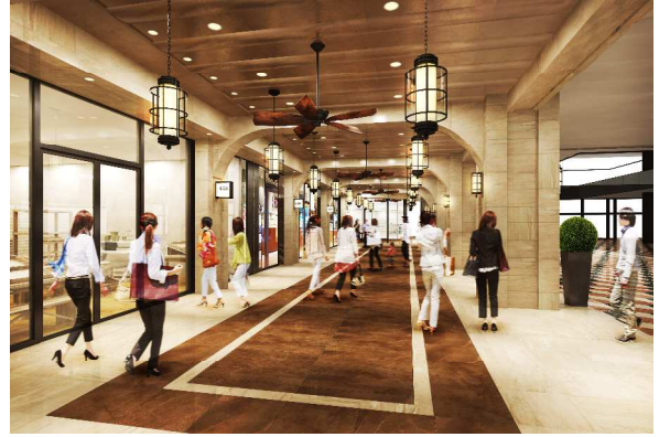
1階フロアイメージ図