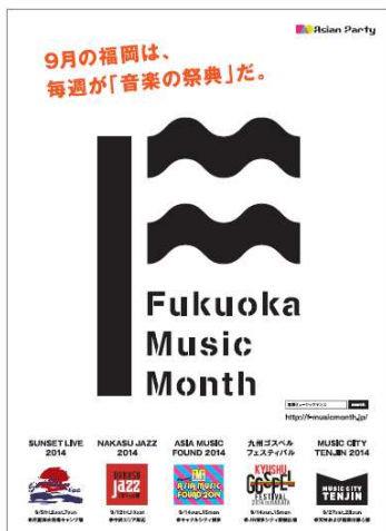
過去PR時のビジュアル