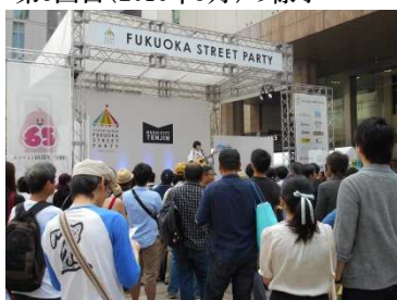
第5回目(2016年9月)の様子