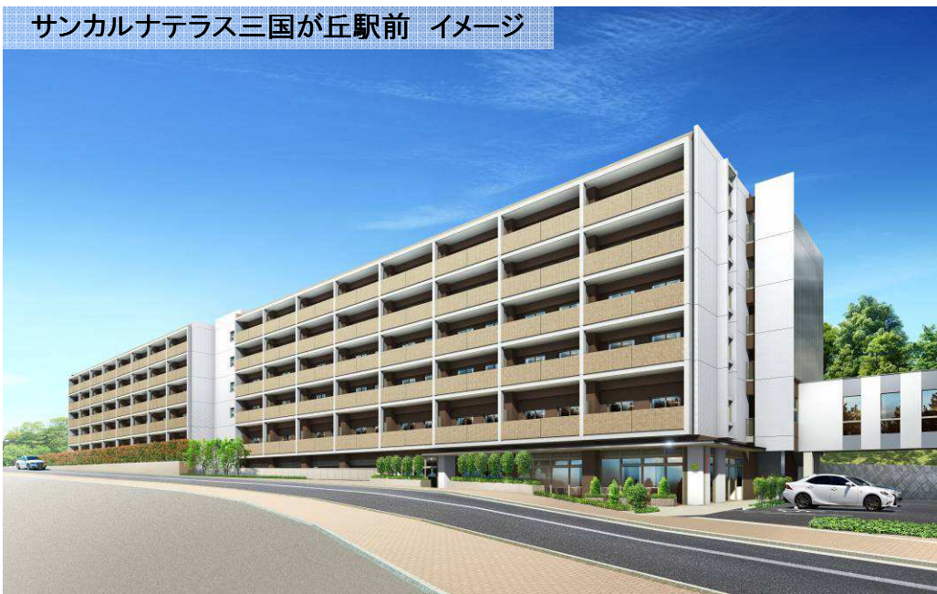
サンカルナテラス三国が丘駅前 イメージ