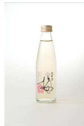
太宰府梅サイダー

〔その他〕 ・その他 4 台のラッピング車両も登場し、新車両とともに同ルート を運行します。(天神発、博多発各 3 台ずつ)