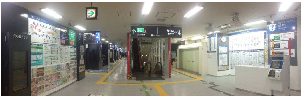
〔リニューアルされた博多バスターミナル 1 階バスターミナル(博多駅方面出入口から)〕