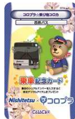
〔乗り物コロカ イメージ〕