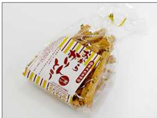
おからかりんとう(ときめきショップありがた屋)