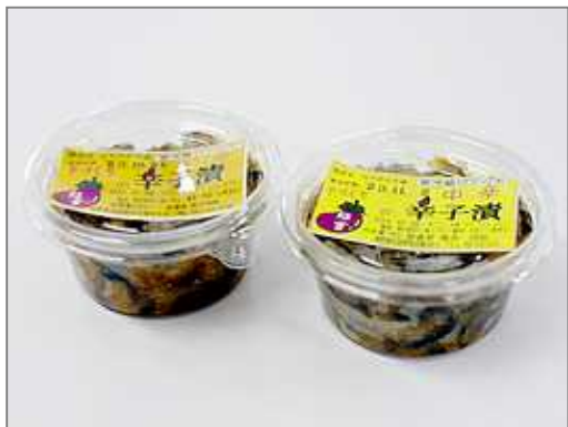
なすの辛子漬け(博多名水本舗)