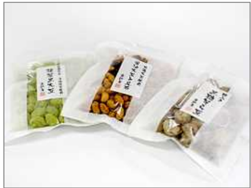
~ 粉ふき黒糖そら豆・抹茶黒大豆・ 昆布入り醤油大豆(高砂屋)