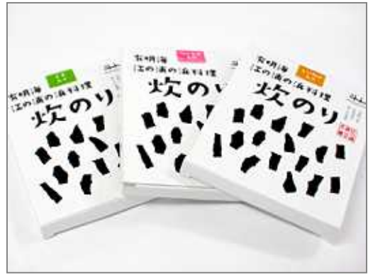
炊き海苔(江の浦海苔本舗)