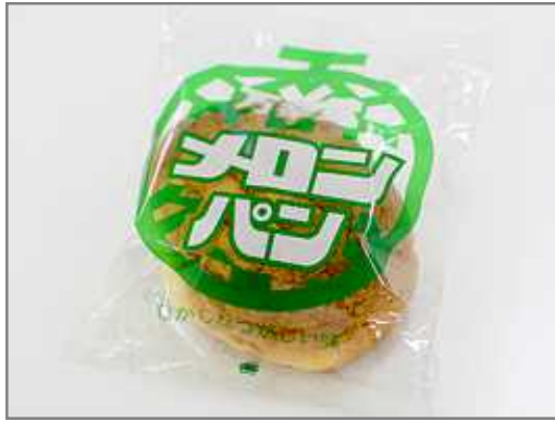
メロンパン(万幸堂)