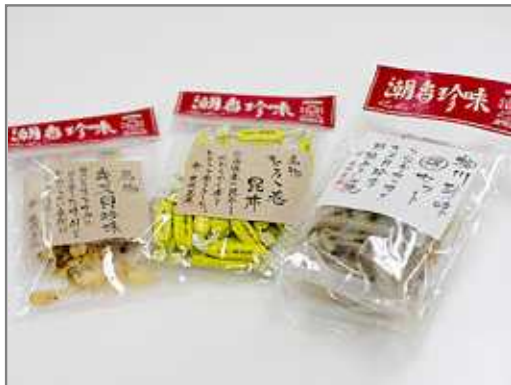
~ とろろ巻昆布・キヌ貝珍味・ 珍味セット(夜明茶屋)