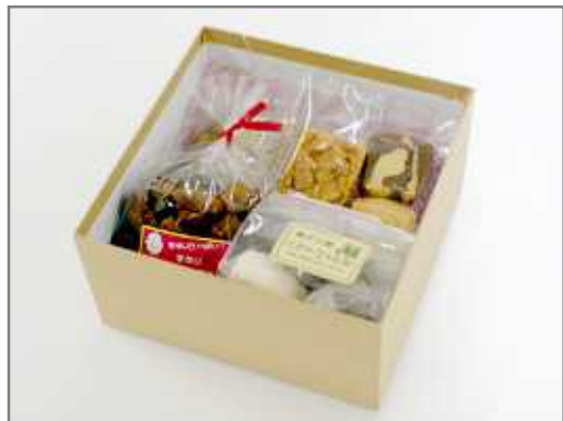
お菓子の詰合せ(ときめきショップありがた屋)