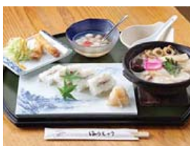
ガンバ(ふぐ)寿司セット

「銀座食堂」 営業時間 11:00~20:00 定休日 金曜日 電話番号 0957-62-4070