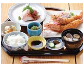
エビフライセット

「お食事処 都一」 営業時間 11:00~14:00 17:00~21:00 定休日 木曜日 電話番号 0957-62-3323