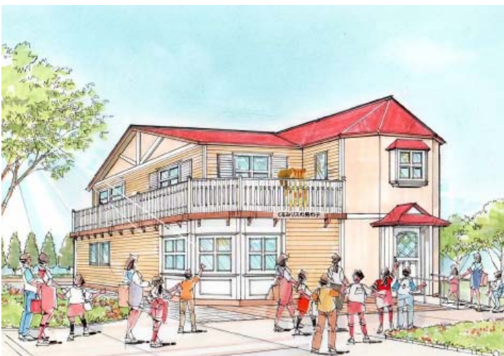
“あかりの灯る大きなお家”