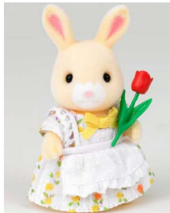
〈シルバニアガーデン オリジナルキャラクター〉 はなぞのウサギの女の子