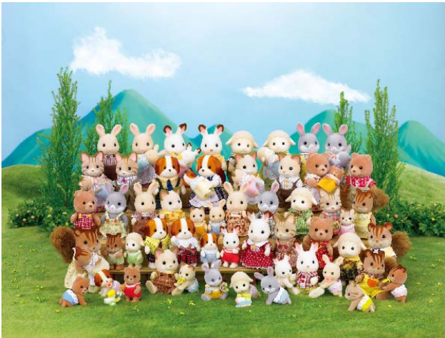
シルバニアファミリー イメージ①