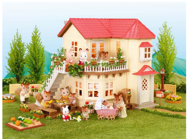
シルバニアファミリー イメージ②