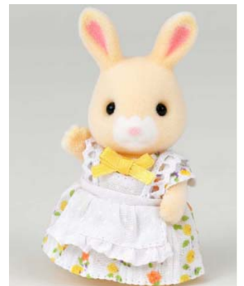
はなぞのウサギファミリー